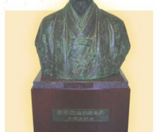
吉田三郎「板谷波山先生之像」