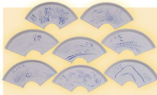
小杉放庵(画)・板谷波山(作陶)「大雅堂瀟湘八景 扇面小皿」