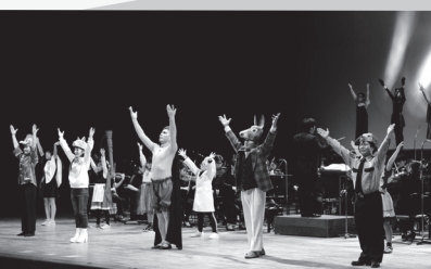
昨年の公演の様子