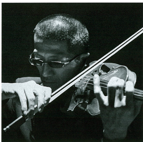
石田 泰尚(ヴァイオリン)