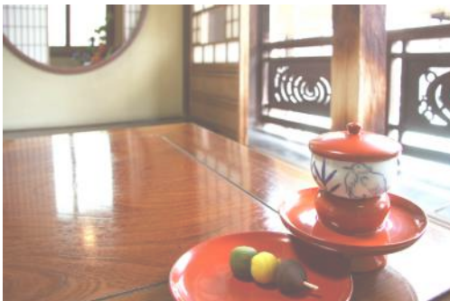
▲子規と親友・夏目漱石も訪ねた松山道後温泉