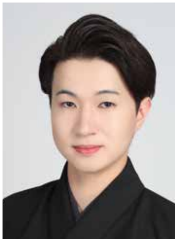
長唄 杵屋神威 きねや かむい