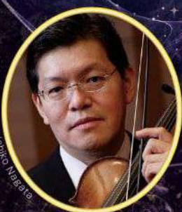
指揮・ヴァイオリン 寺神戸 亮

[セミ・ステージ形式/1711年版・全3幕/イタリア語上演・日本語字幕付] 原作:トルクアート・タツ 叙事詩『解放されたエルサレム』