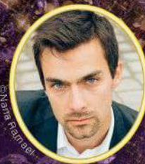
魔法使い ヨナタン・ド・クースター