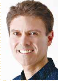
ピエール=フランソワ・ドレ (演出・振付・バロックダンス)