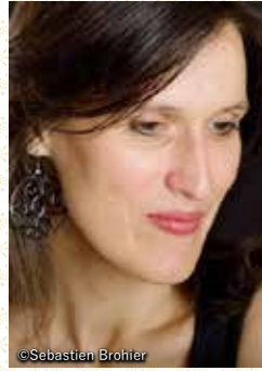
クレール・ルフィリアートル (ソプラノ)