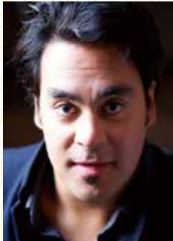
フィリップ・タルボ (テノール)