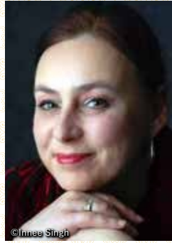
ロマナ・アニエル (演出)