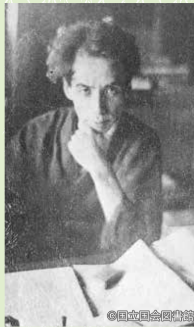
「芥川龍之介 肖像写真」

※DMM GAMESより配信中の文豪をキャラクター化したゲーム「文豪とアルケミスト」とタイアップもしています。田端文士のキャラクターパネルも是非ご覧ください。