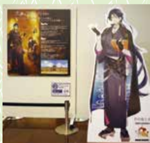
「文豪とアルケミスト」に登場する芥川龍之介