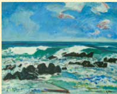
「空と海」 1980年代 油彩画

東京府北豊島郡岩淵町(現在の北区岩淵町)に生まれ、若くして日本の画壇を牽引した大野五郎(1910-2006)。北区に寄贈された数多くの油彩画から、大作・小品をまじえて展示します。