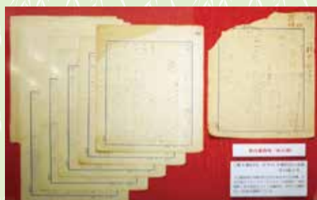
「続文藝的な、余りに文藝的な」原稿