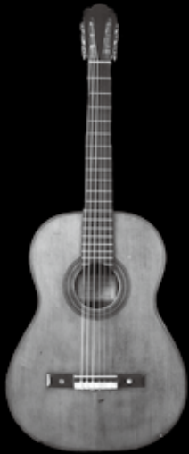
アントニオ・デ・トーレス