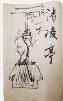
「游心帖」より芥川の筆とされる書画