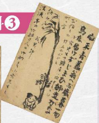
芥川龍之介・小穴隆一連名 小澤碧童宛葉書 大正9年12月28日