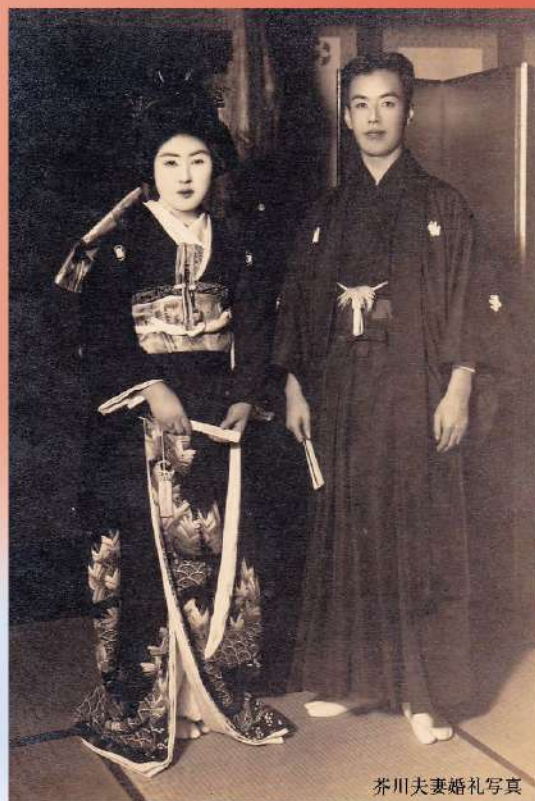
芥川夫妻婚礼写真