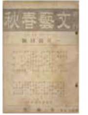
『文藝春秋』創刊号 文藝春秋社