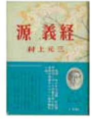
『源義経』 朝日新聞社