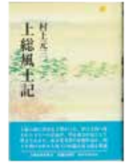
『上総風土記』 六興出版