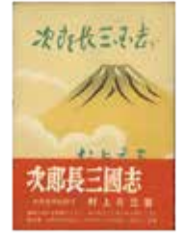
『次郎長三國志』 文藝春秋新社