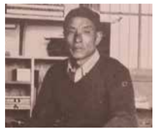
小杉放庵「アトリエ」 昭和12年3月号 アトリエ出版社