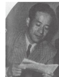
川口松太郎『日の出』 昭和15年1月号新潮社