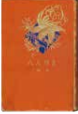
菊池 寛『真珠夫人』 新潮社