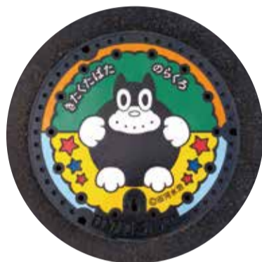
▲令和2年に田端小学校前の通りに設置された「のらくろ」のデザインマンホール蓋

その後、昭和20年4月13日の空襲によって、田端の街並みのほとんどが失われてしまいました。戦争により田端文士村は終焉を迎えますが、明治の終わりから昭和にかけて田端がはぐくんだ作品や芸術文化はいまに続いています。