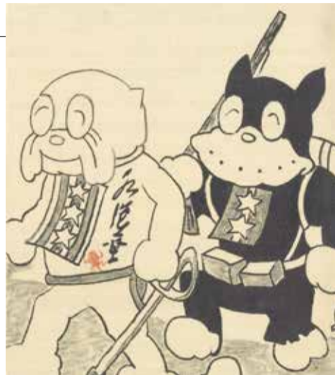
▶田河水泡 色紙「ブル連隊長とのらくろ」