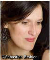
アルミード クレール・ルフィアートル (ソプラノ)

フランス・バロック・オペラの最高峰を 日本で初めて全編本格上演! バロックダンスのスペシャリストがこの傑作に魔法をかける!