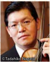
指揮 ヴァイオリン 寺神戸 亮