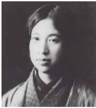
平塚らいてう

「元始女性は実に太陽であった」という、今も語り継がれる名文を残した平塚らいてうは、本年、没後50年の節目を迎えます。本展では、らいてうが田端で過ごした時代を中心に、その社会的な活動から家庭的な一面までをご紹介します。