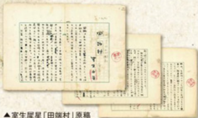
▲室生犀星「田端村」原稿