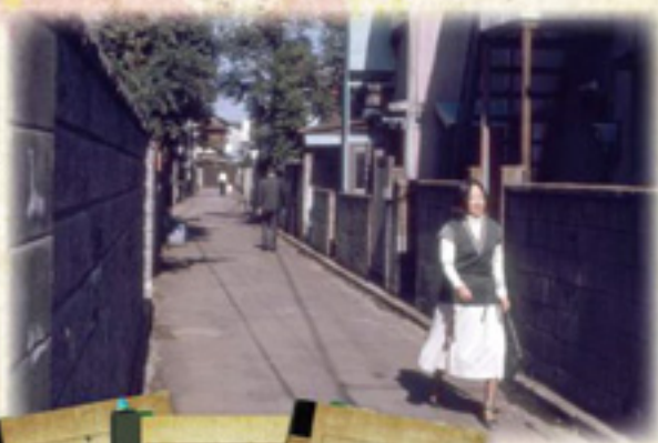
「田端文士村」取材風景▶ 芥川龍之介旧居跡前にて