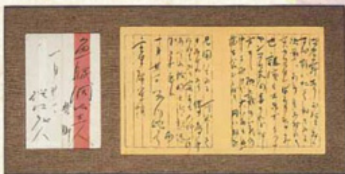
▲芥川龍之介 室生犀星宛書簡(大正14年1月31日付)