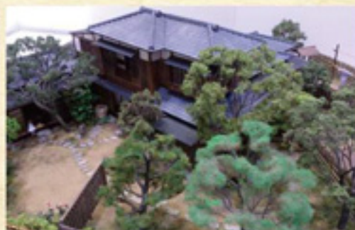
▲芥川龍之介 田端の家復元模型(1/30スケール)

また、2017(平成29)年は龍之介にとって没後90年、そして死を看取った主治医・下島勲の没後70年にあたります。2人をはじめとした龍之介の幅広い交友関係に焦点をあて、作品とともに周辺の田端文士・芸術家との交流を紹介します。