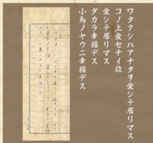
▲初公開 芥川龍之介 文に宛てたラブレター