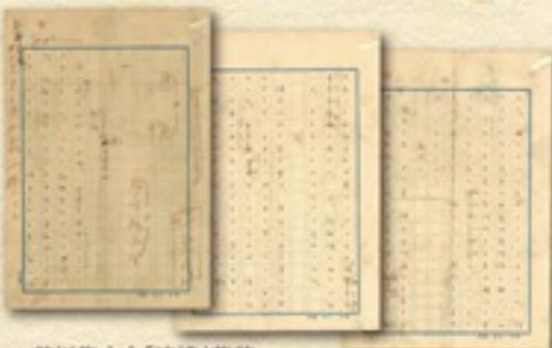
▲芥川龍之介「追憶」草稿