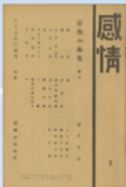
雑誌「感情」3号(大正5年8月) 当時の詩壇に一石を投じた詩の雑誌。 32冊を刊行し、3号からは田端で発行。