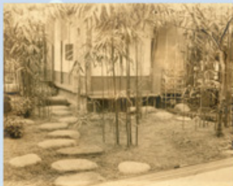
星屋の田端自宅(離れ)