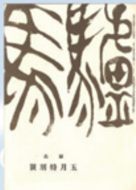
雑誌「驢馬」(大正15年5月) 犀星の元に集まった中野重治・堀辰雄ら が創刊。5月特別号には犀星、朔太郎、 龍之介も寄稿した。

大正2(1913)年、犀星の抒情詩に感動した朔太郎が手紙を送り、生涯を通じた交友が始まりました。大正5(1916)年、二人は当時の詩壇への反逆の精神をもって雑誌「感情」を創刊、また、処女詩集を発行するなど詩人としての地歩を固めます。大正14(1925)年、朔太郎が田端に移ると、芥川龍之介を加えた三人で交流するなど充実した日々を過ごしました。やがて二人が詩壇での地位を築くと若き作家たちが集まり雑誌「驢馬」を創刊します。大正末期(詩のみやこ)として最盛期を迎えた田端を、資料や交流の中から紹介します。