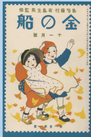
▲『金の船』創刊号 (大正8年)