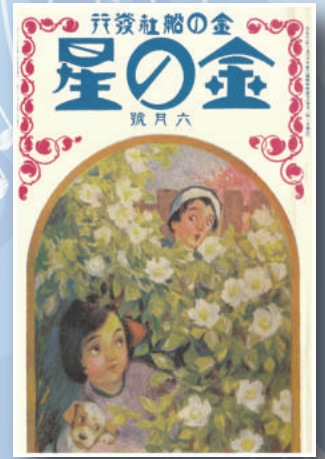
▲『金の星』に名前が変わった 最初の号 (大正11年)