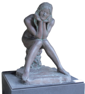
北村 治禧 「妖精I」