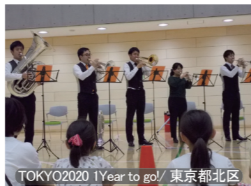
TOKYO2020 1Year to go! / 東京都北区