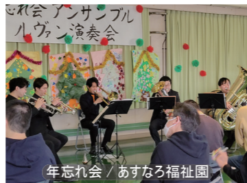
年忘れ会 / あすなろ福祉園