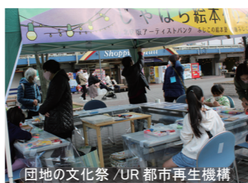
団地の文化祭 / UR 都市再生機構

町会・自治会・商店街をはじめ、企業や福祉施設など さまざまな場所にアーティストを紹介し、皆さまに喜んで いただきました。