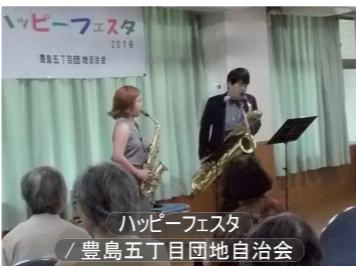
ハッピーフェスタ / 豊島五丁目団地自治会