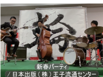
新春パーティ / 日本出版(株)王子流通センター