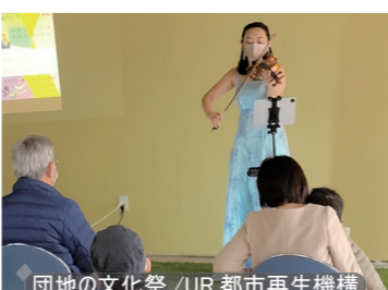
団地の文化祭 / UR 都市再生機構