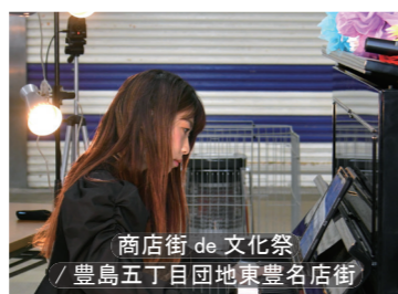
商店街 de 文化祭 / 豊島五丁目団地東豊名店街