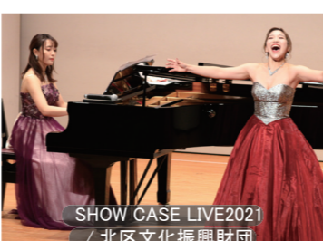
SHOW CASE LIVE2021 / 北区文化振興財団