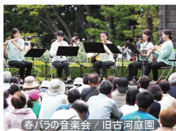
春バラの音楽会 / 旧古河庭園