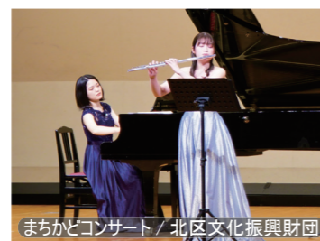
まちかどコンサート / 北区文化振興財団