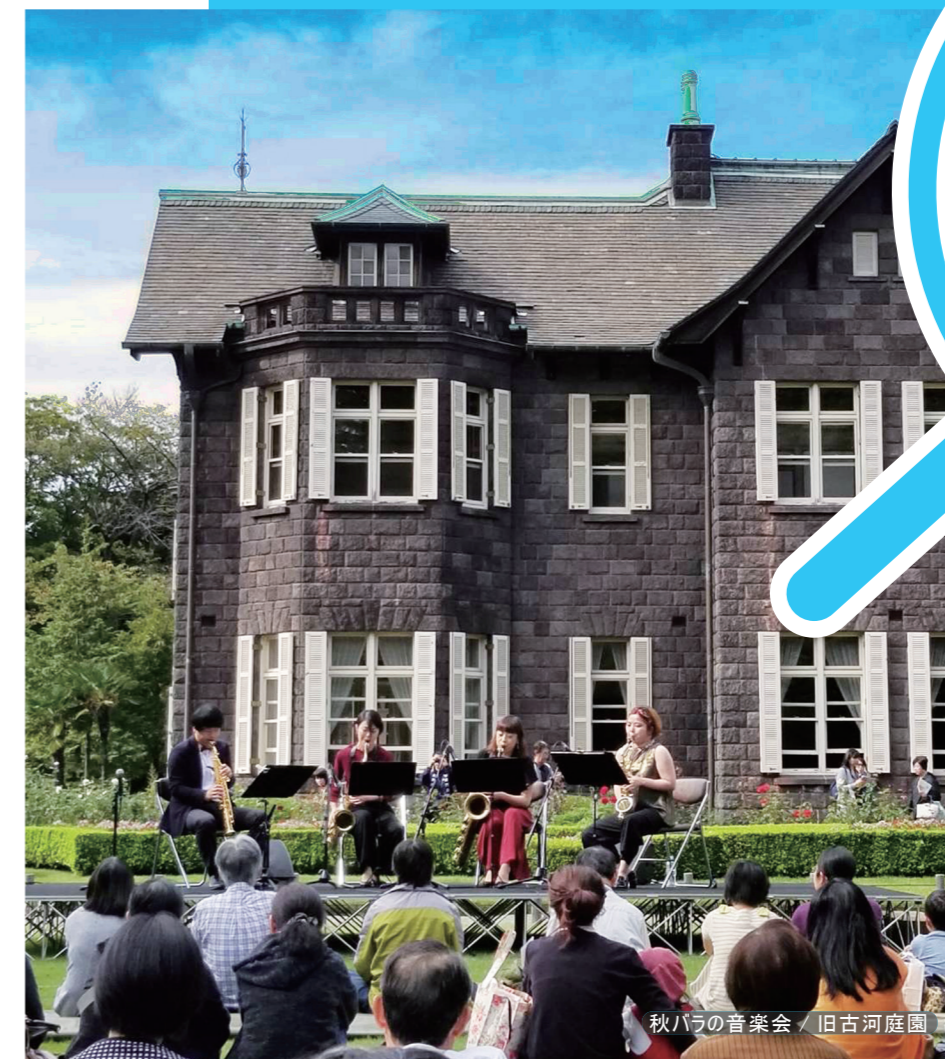
秋バラの音楽会 / 旧古河庭園