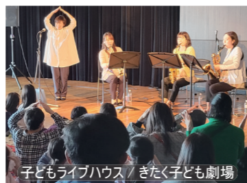
子どもライブハウス / きたく子ども劇場