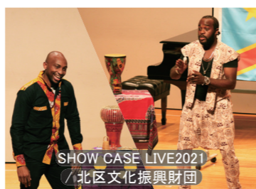
SHOW CASE LIVE2021 / 北区文化振興財団