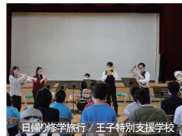
日帰り修学旅行 / 王子特別支援学校