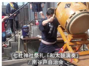
七社神社祭礼「和太鼓演奏」 / 南谷戸自治会