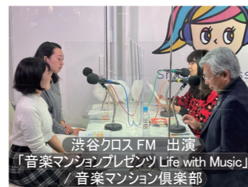
渋谷クロスFM 出演 「音楽マンションプレゼンツ Life with Music」 / 音楽マンション倶楽部