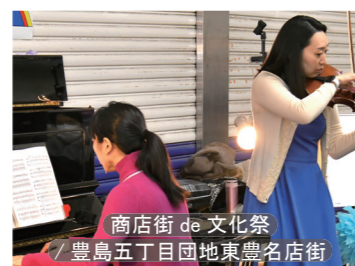
商店街 de 文化祭 / 豊島五丁目団地東豊名店街