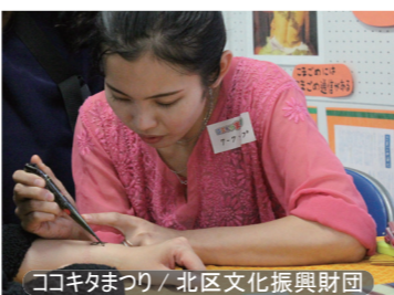
ココキタまつり / 北区文化振興財団