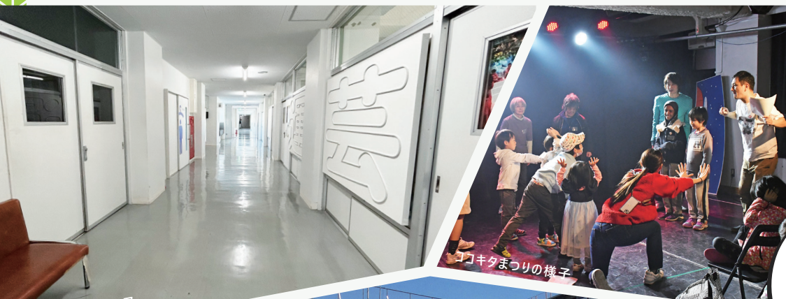
3階レジデンスフロア