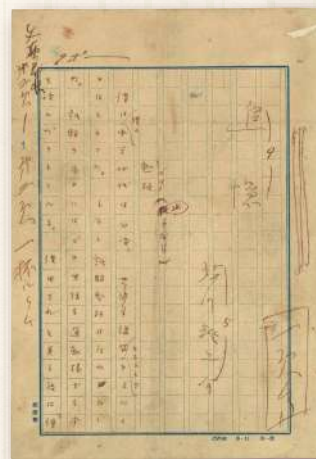
芥川龍之介「追憶」原稿