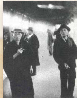
左:室生犀星 右:萩原朔太郎 (昭和14年10月19日)