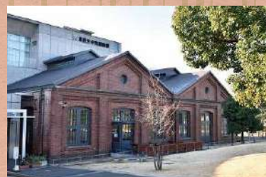
▲北区立中央図書館