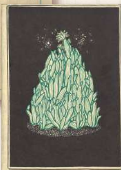
萩原朔太郎『月に吠える』