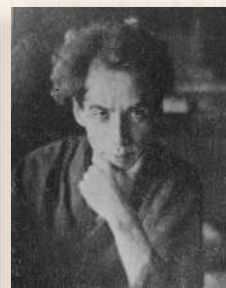
芥川龍之介 ©「近代日本人の肖像」 (国立国会図書館)